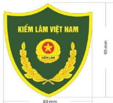
MẪU SỐ 2. PHÙ HIỆU KIỂM LÂM