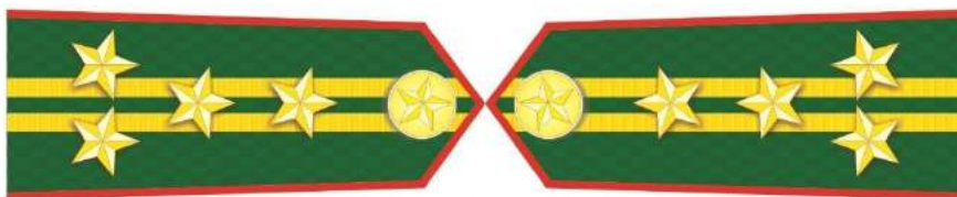
MẪU SỐ 5d. NGƯỜI ĐỨNG ĐẦU KIỂM LÂM VÙNG, KIỂM LÂM CẤP TỈNH