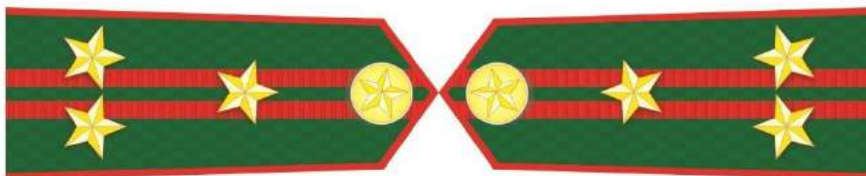
MẪU SỐ 5d. PHÓ TRƯỞNG PHÒNG VÀ TƯƠNG ĐƯƠNG THUỘC KIỂM LÂM TRUNG ƯƠNG