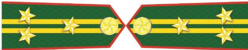
MẪU SỐ 5e. CẤP PHÓ CỦA NGƯỜI ĐỨNG ĐẦU KIỂM LÂM VÙNG, KIỂM LÂM CẤP TỈNH