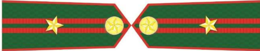
MẪU SỐ 5h. PHÓ TRƯỞNG PHÒNG VÀ TƯƠNG ĐƯƠNG THUỘC KIỂM LÂM VÙNG, KIỂM LÂM CẤP TỈNH