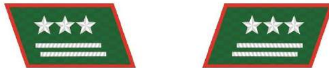
MẪU 7d. PHÓ TRƯỞNG PHÒNG VÀ TƯƠNG ĐƯƠNG THUỘC KIỂM LÂM TRUNG ƯƠNG