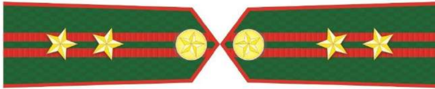
MẪU SỐ 5g. TRƯỞNG PHÒNG VÀ TƯƠNG ĐƯƠNG THUỘC KIỂM LÂM VÙNG, KIỂM LÂM CẤP TỈNH