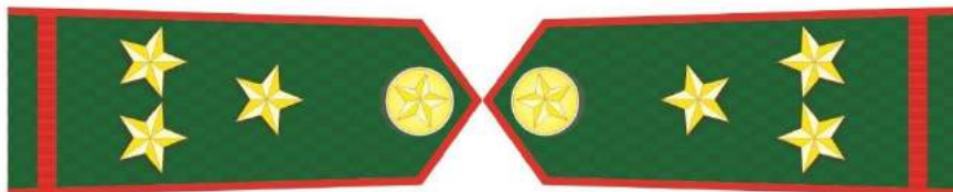
MẪU SỐ 5m. PHÓ TRƯỞNG TRẠM KIỂM LÂM