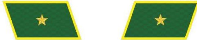
MẪU SỐ 7b. CẤP PHÓ CỦA NGƯỜI ĐỨNG ĐẦU KIỂM LÂM TRUNG ƯƠNG