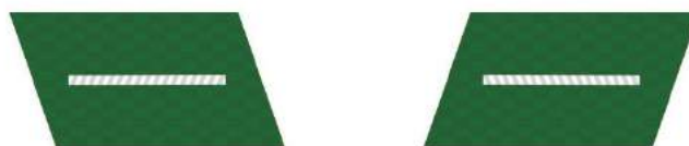
MẪU SỐ 8đ. NHÂN VIÊN KIỂM LÂM KHÁC