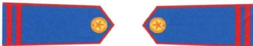
NHÂN VIÊN BẢO VỆ RỪNG CÓ THỜI GIAN LÀM VIỆC TỪ 5 NĂM TRỞ LÊN