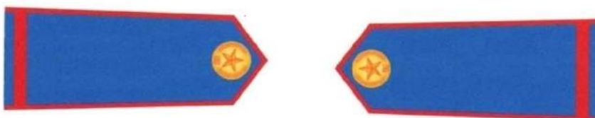
NHÂN VIÊN BẢO VỆ RỪNG CÓ THỜI GIAN LÀM VIỆC DƯỚI 5 NĂM