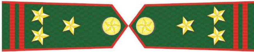
MẪU SỐ 6a. KIÊM LÂM VIÊN CAO CẤP