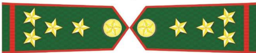
MẪU SỐ 5l. TRƯỞNG TRẠM KIỂM LÂM