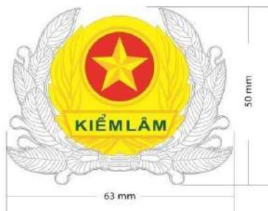
MẪU SỐ 1. KIỂM LÂM HIỆU