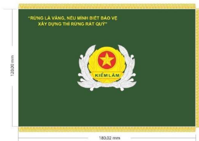
MẪU SỐ 4. CỜ TRUYỀN THỐNG KIỂM LÂM