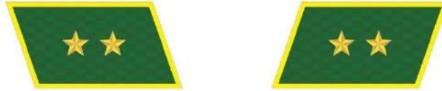
MẪU SỐ 7a. NGƯỜI ĐỨNG ĐẦU KIỂM LÂM TRUNG ƯƠNG