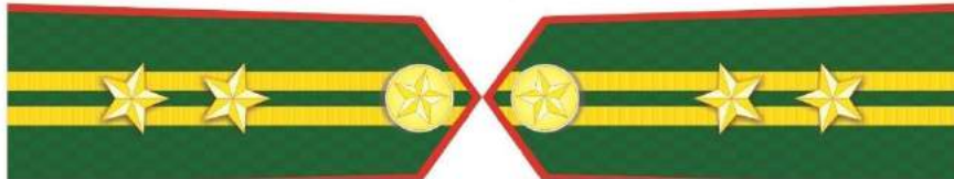
MẪU SỐ 5i. NGƯỜI ĐỨNG ĐẦU KIỂM LÂM CẤP HUYỆN, KIỂM LÂM RỪNG ĐẶC DỤNG, RỪNG PHÒNG HỘ