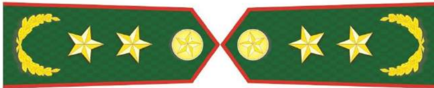
MẪU SỐ 5a. NGƯỜI ĐỨNG ĐẦU KIỂM LÂM TRUNG ƯƠNG