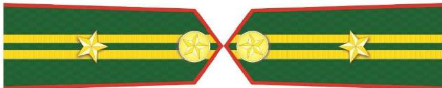
MẪU SỐ 5k. CẤP PHÓ CỦA NGƯỜI ĐỨNG ĐẦU KIỂM LÂM CẤP HUYỆN, KIỂM LÂM RỪNG ĐẶC DỤNG, RỪNG PHÒNG HỘ