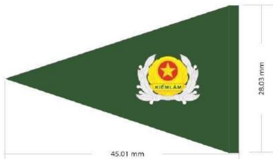
MẪU SỐ 3. CỜ HIỆU KIỂM LÂM