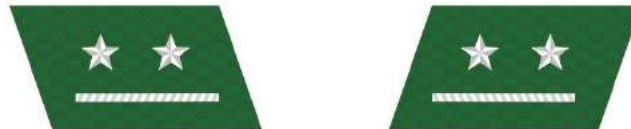
MẪU SỐ 8c. KIỂM LÂM VIÊN