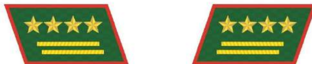
MẪU SỐ 7d. NGƯỜI ĐỨNG ĐẦU KIỂM LÂM VÙNG, KIỂM LÂM CẤP TỈNH