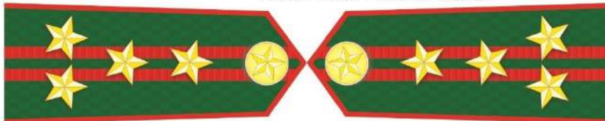
MẪU SỐ 5c. TRƯỞNG PHÒNG VÀ TƯƠNG ĐƯƠNG THUỘC KIỂM LÂM TRUNG ƯƠNG