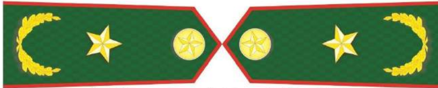
MẪU SỐ 5b. CẤP PHÓ CỦA NGƯỜI ĐỨNG ĐẦU KIỂM LÂM TRUNG ƯƠNG