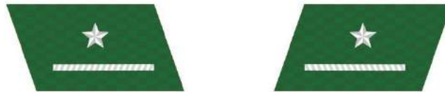
MẪU SỐ 8d. KIỂM LÂM VIÊN TRUNG CẤP