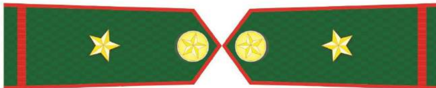
MẪU SỐ 6d. KIÊM LÂM VIÊN TRUNG CẤP