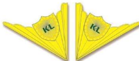
MẪU SỐ 10. BIỂU TƯỢNG KIỂM LÂM