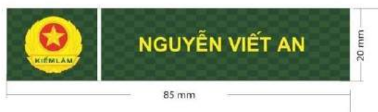
MẪU SỐ 9. BIỂN TÊN