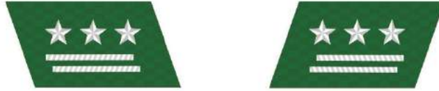
MẪU SỐ 8a. KIỂM LÂM VIÊN CAO CẤP